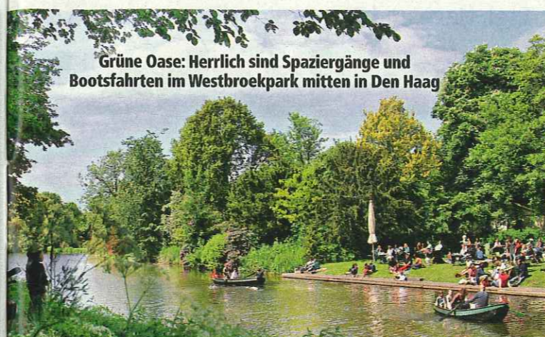
Grüne Oase: Herrlich sind Spaziergänge und Bootsfahrten im Westbroekpark mitten in Den Haag

Essen & Genießen Dieser Imbiss ist Kult: In der Papestraat Nr. 1 steht „t Kleinste Winkelje“ – die kleinste Frittenbude von Den Haag! Das Lokal ist nicht einmal einen Meter breit und bietet die besten „Patat met Pindasaus“ (Pommes mit Erdnussdip) der Niederlande. Verkauft werden hier auch die legendären holländischen Kroketten. Ein Traum für Naschkatzen ist die Patisserie „Dessertwinkel“ im Westvlietweg 66F. Tipp: Das Lavendel-Dessert mit Himbeeren und weißer Schokolade sollten Sie unbedingt kosten!