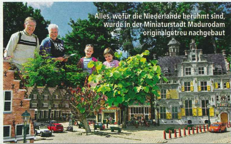
Alles, wofür die Niederlande berühmt sind, wurde in der Miniaturstadt Madurodam originalgetreu nachgebaut

dem Boulevard, gut essen und trinken in den Strandpavillons – hier ist Urlaubsfeeling pur angesagt! Für Unterhaltung sorgen das „Holland Casino“, das Circustheater und ein Megakino.