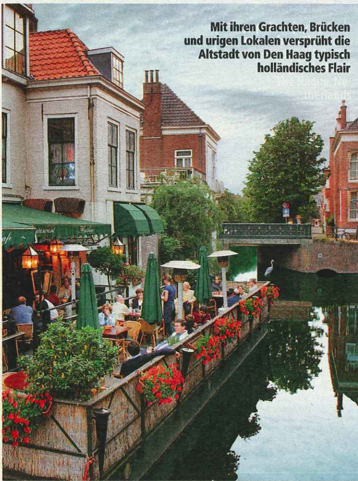
Mit ihren Grachten, Brücken und urigen Lokalen versprüht die Altstadt von Den Haag typisch holländisches Flair

der berühmte Rittersaal. Vieles davon kann man besichtigen (Mo–Sa 10–16 Uhr, Eintritt ab 4 Euro). In der Nähe des Binnenhofes verzaubert die Prachtallee „Lange Voorhout“ mit vielen schönen Gebäuden. Hier flanieren man auf Gehwegen, die nach alter holländischer Tradition mit Muschelstücken anstatt Kieselsteinen angelegt wurden. Nur sechs Kilometer vom Stadtzentrum entfernt liegt Den Haags Stadtteil Scheveningen mit dem beliebtesten Strand der holländischen Nordseeküste. Ein Bad im Meer, Flanieren auf