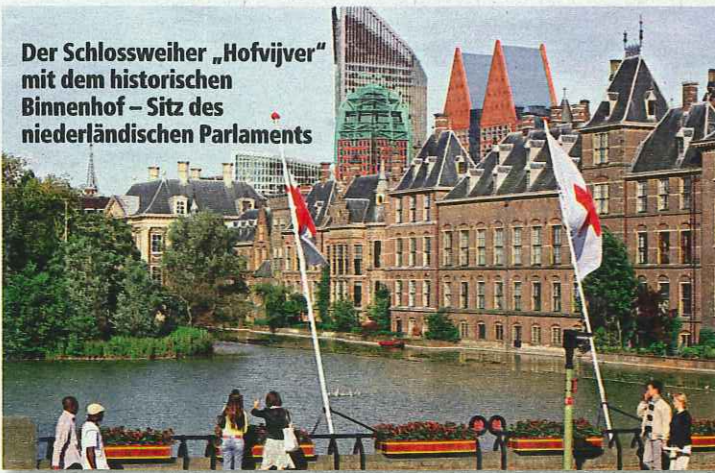
Der Schlossweiher „Hofvijver“ mit dem historischen Binnenhof – Sitz des niederländischen Parlaments