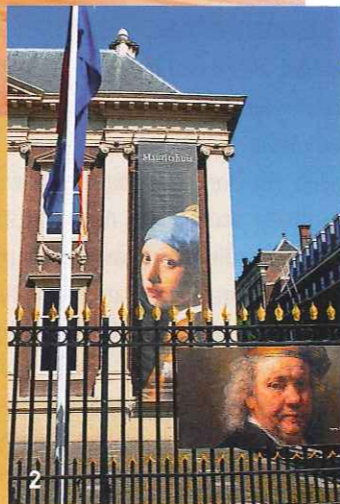
KUNSTRÄUME Im Gemeentemuseum (1); Mauritshuis (2)

Kunst zum Kaufen, Möbel, Design und Asiatica findet man im Antiquitätenquartier zwischen Dr. Kuyperstraat, Denneweg und der Langen Voorhout. Auf Holländisch heißt »Hout« Holz – Lange Voorhout bedeutet Vorstadtwald. Von Wald kann keine Rede mehr sein, aber eine breite Promenade unter Schatten spendenden Linden ist geblieben. Die Kopie kennt man aus Berlin. Ringsum fallen prächtige, re-